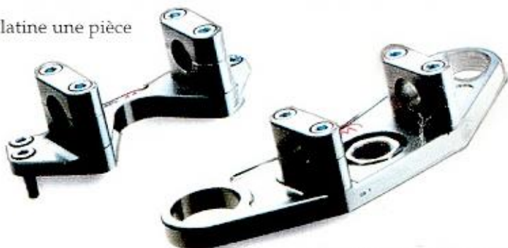
Platine une pièce